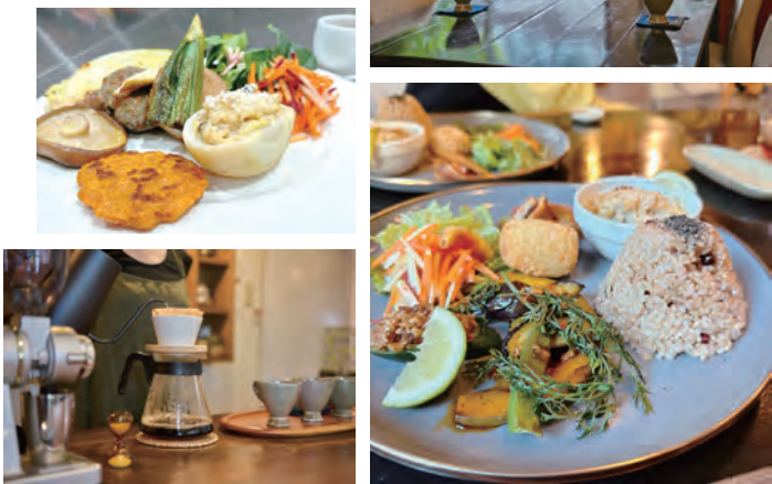
落ち着いた店内で頂くオーガニック野菜と玄米の料理。コーヒーもオーガニック。