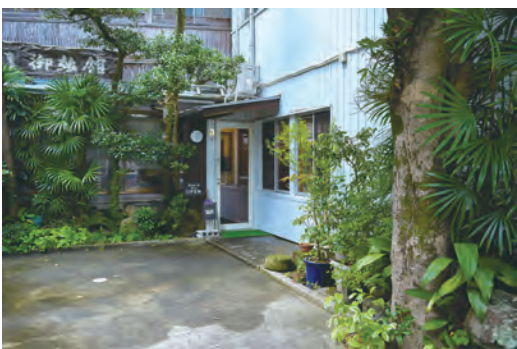
船頭町の昔ながらの景観にマッチしたカフェ茶蔵

また、同じタイミングで佐伯市が「佐伯市食育推進会議条例」を制定し、様々な分野の有識者で組織する会議の委員として携わるようになりました。 久しぶりの食育ワークショップですが、原点に戻って、玄米の美味しい炊き方を中心にオーガニック野菜の料理を紹介しようと思っています。