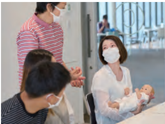
人形を使って赤ちゃんの抱き方を学びます。