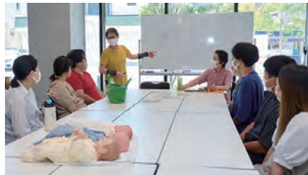
授乳に際しての注意を真剣に聞いています。