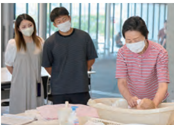
沐浴のやり方を学び、実際にチャレンジします。