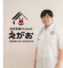
在宅支援クリニックがお 医師

病気があっても障がいがあっても、地域の中で必要とされ、役割を与えられ、感謝され、誰もが尊いひとりの人として生きることができるハートフルな地域づくりに医師として貢献したく、一般社団法人共生社会実現サポート「とんとんとん」を設立し、理事長を務めている。