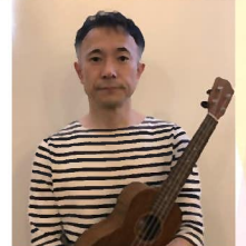
アートコザウルス(みんなの芸術祭)実行委員長

障がい者施設「さつき園」に勤務して25年。利用者や職員と一緒に働き、一緒に学び、一緒に楽しみ、歩んでいます。中でもアートや音楽、フラダンスの活動を通して、地域との関わりが生まれ、今後もそうした活動を継続していければと思っています。更にみんなでワクワクするようなこと、探しています！