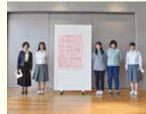
クリスマスディスプレイ

グループに分かれて、意見を出し合います。それぞれの好みや個性が出てきてユニークな意見も出てきます。