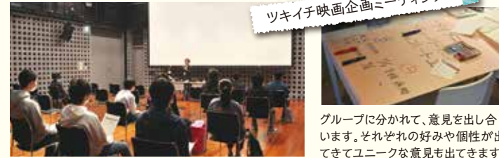
ツキイチ映画企画ミーティング

桜ホールで開催する行事を企画したり、館内のディスプレイをしたりとあまり表には出ないけど重要な役割を担う企画サポートグループ。「ツキイチ映画」の企画についてのミーティングや、クリスマスディスプレイに奮闘の様子をお伝えします。